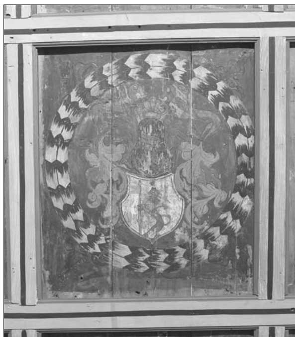
16. ábra A címeres kazetta. 2013