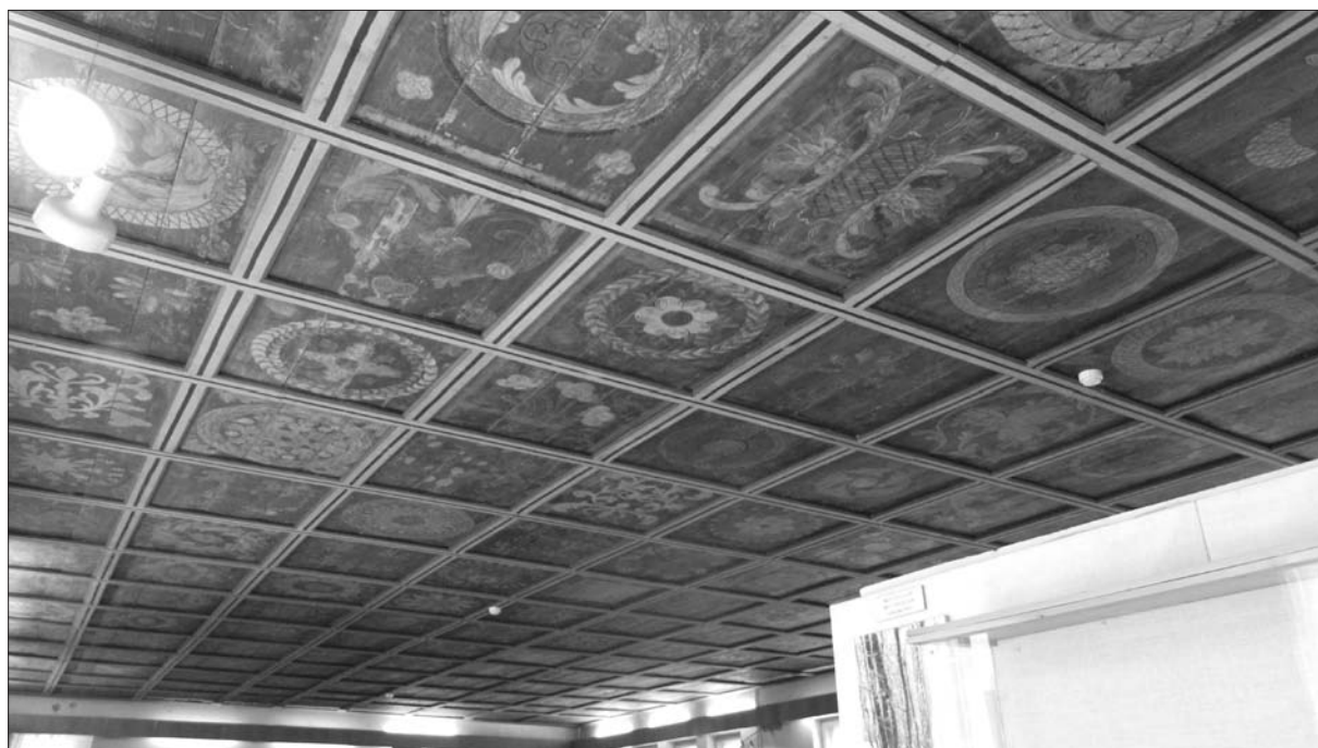
13. ábra A barátosi mennyezet a Székely Nemzeti Múzeum néprajzi alapkiállításán. Fotó: Szócsné Gazda Enikő, 2012