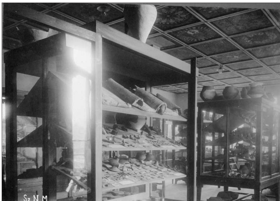
9. ábra A Székely Nemzeti Múzeum régiségtára, mennyezetén a barátosi mennyezettel. Fotó: Incze Lajos, 1924. SzNM Fototékája, ltsz. F. 446