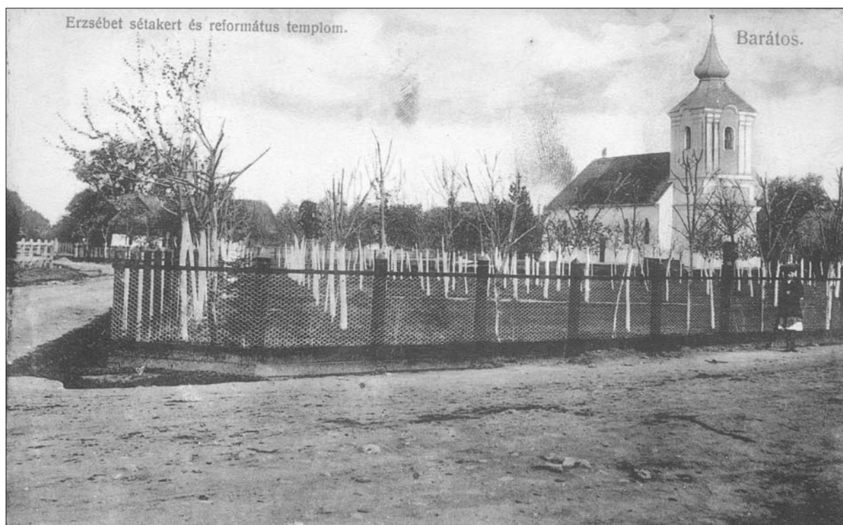
8. ábra 1913-as postai bélyegzőjű képeslap az új barátosi templomról. Székely Nemzeti Múzeum Fototékája, JA10-033-1-es lelt. sz.