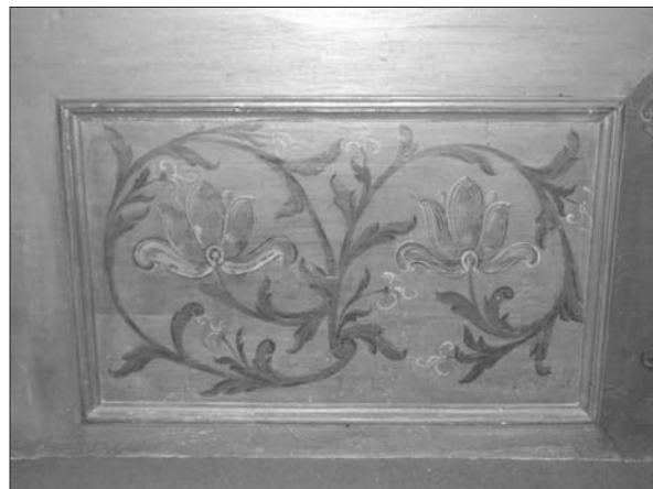
4. ábra Az alsócsernátoni templom festett padmellvédje.