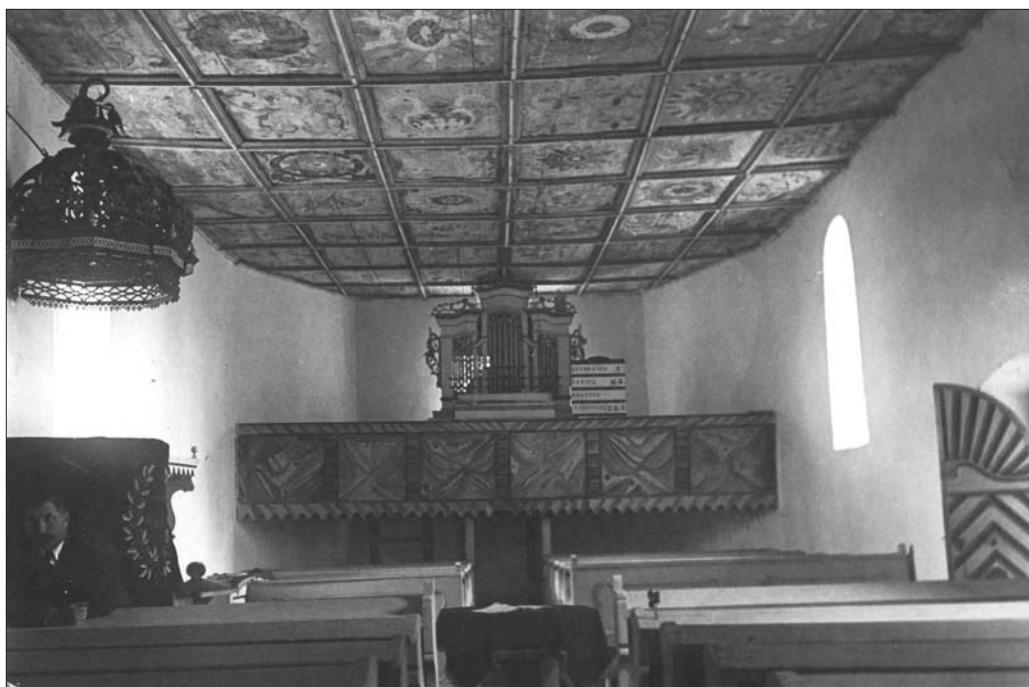
5. ábra A kálnoki unitárius templom mennyezete az átfestés előtt. Fotó: Gödri Ferenc, 1931 SzNM Fototékája, ltsz. F. 231