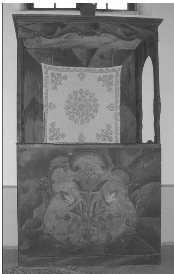
3. ábra A maksai festett papi szék.