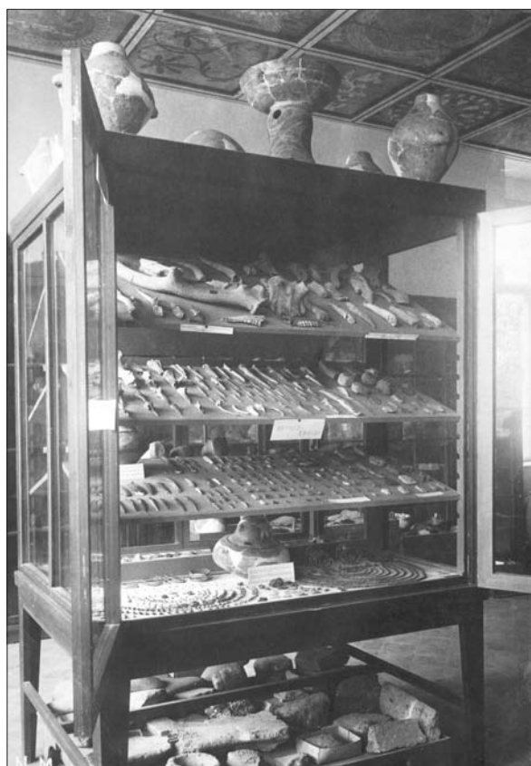
10. ábra A Székely Nemzeti Múzeum régiségtára, mennyezetén a barátosi mennyezettel. Fotó: Incze Lajos, 1927. SzNM Fototékája, ltsz. F. 457