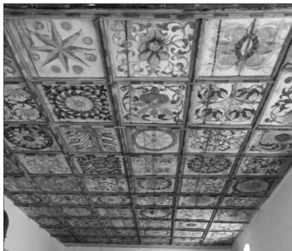
1. ábra A szacsvai templom kazettás mennyezete. Fotó: Szócsné Gazda Enikő, 2012