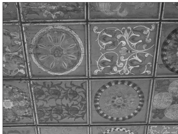
2. ábra A maksai templom kazettás mennyezete az Iparművészeti Múzeumban.