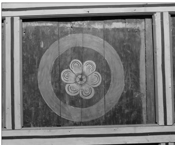
11. ábra A 42-es kazetta, a kockázott edény maradványaival. Fotó: Mihály Ferenc, 2013