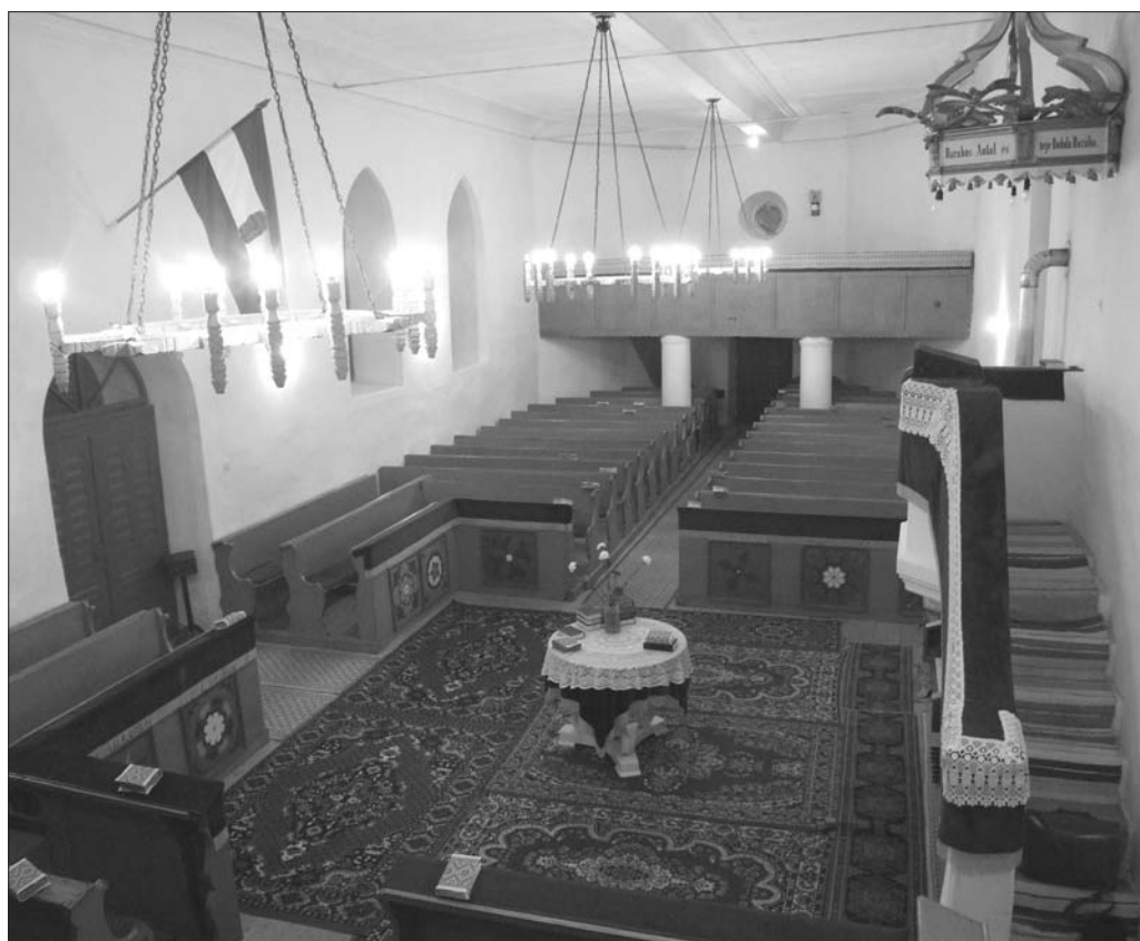
6. ábra Barátosi templombelső. Fotó: Mihály Ferenc, 2012