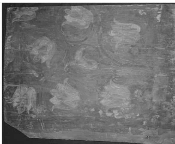
14–15. ábra A mennyezet két, föl nem szerelt kazettája a néprajzi gyűjteményben.