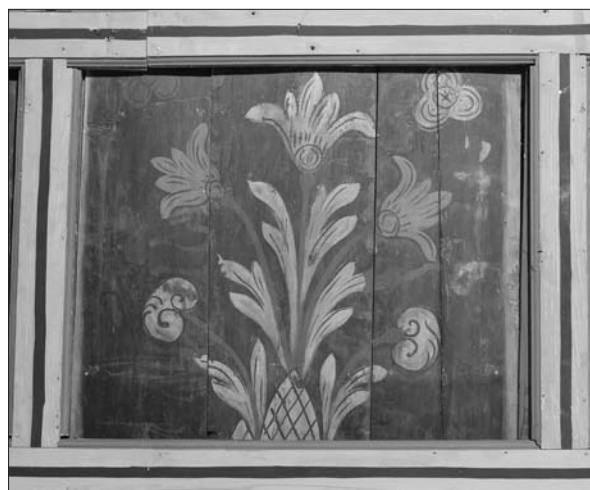
12. ábra a 84-es kazetta, amelynek aljából hiányzik a kockázott edény darabja. Fotó: Mihály Ferenc, 2013