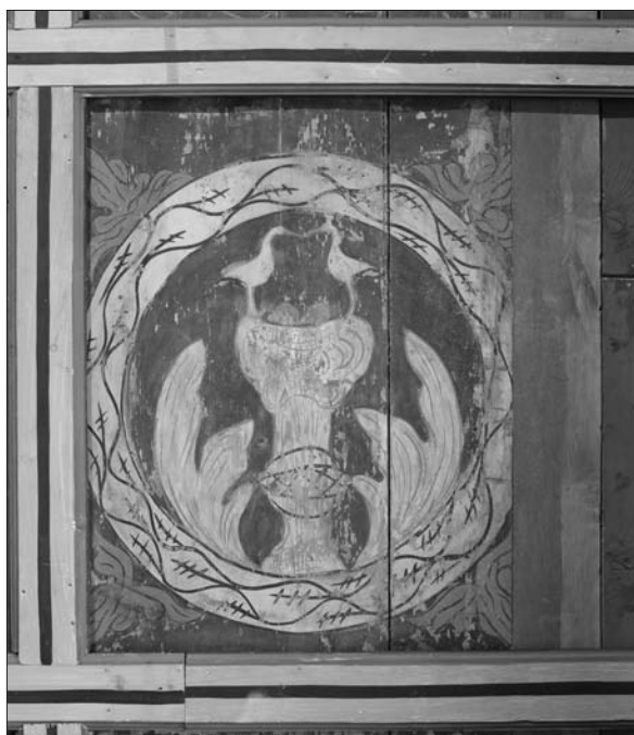
17. ábra A gólyás kazetta. Fotó: Mihály Ferenc, 2013