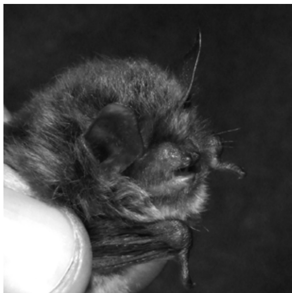
Figura 2 Myotis alcathoe – exemplar capturat în Cheile Vârghișului.