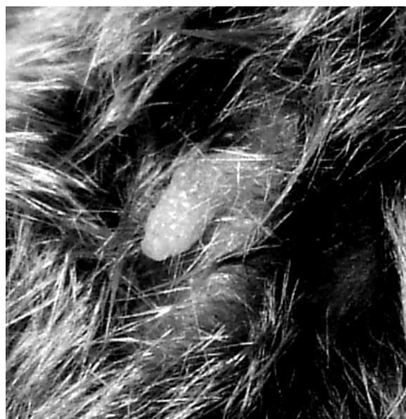
Figura 5 Forma penisului.