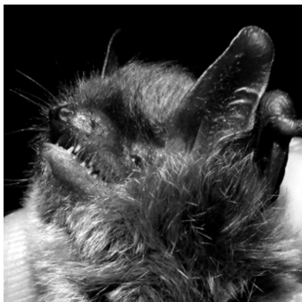
Figura 4 Forma tragusului și a nărilor la exemplarul capturat.