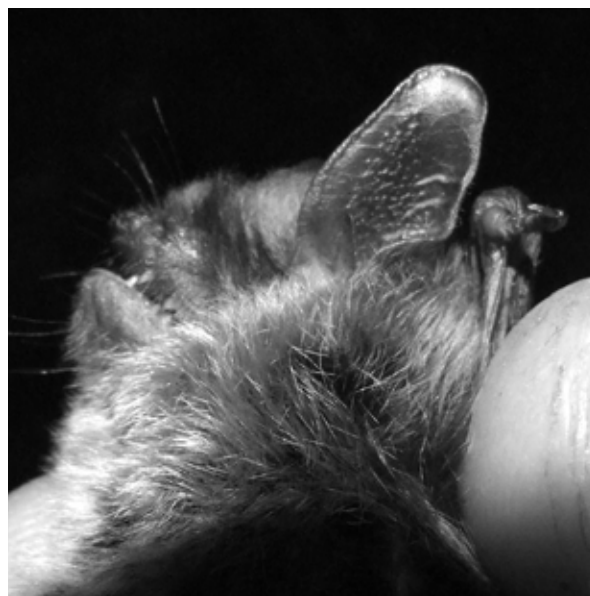
Figura 3 Myotis alcathoe – exemplar capturat în Cheile Vârghișului.